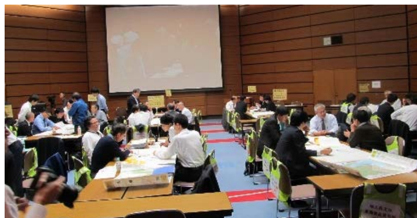
平成29年11月14日 名古屋市内 (参加者数 91名/46団体)