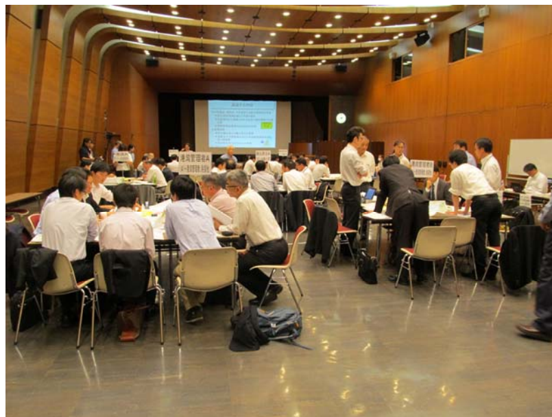
昨年度の代替輸送訓練の開催状況