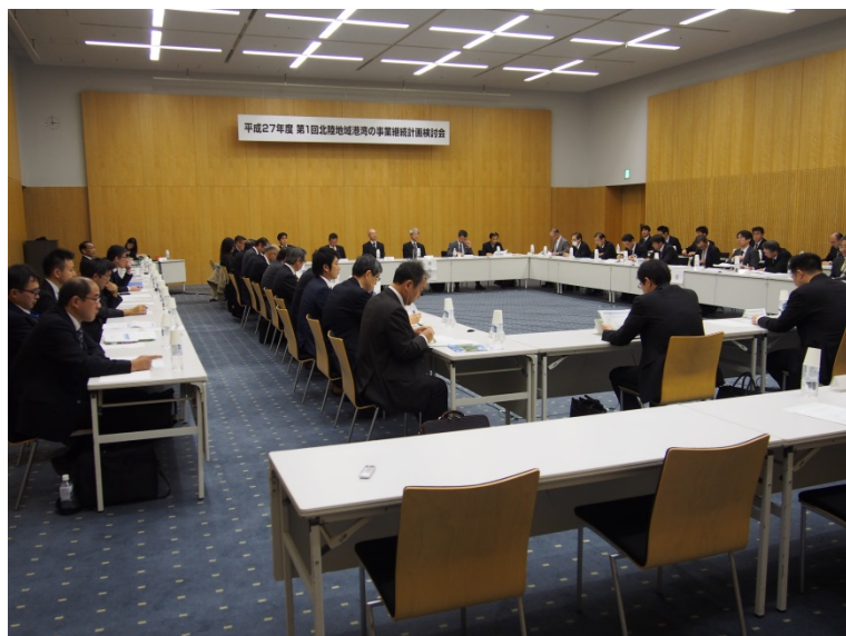
平成27年度 第1回検討会開催状況