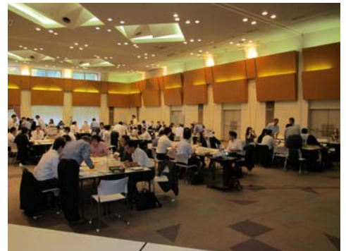
【10.9 東京会場でのワークショップの様相】

東日本大震災では、被災地の港湾が復旧するまでの間、日本海側の港湾が代替輸送の機能を果たし、被災地の復旧・復興に大きく貢献しました。北陸地域国際物流戦略チーム（北陸地方整備局・北陸信越運輸局）では、発生が危惧されている首都直下地震・南海トラフ地震などにおいて日本海側の港湾での代替輸送を確実なものとするため、昨年度に引き続き代替輸送訓練を実施します。