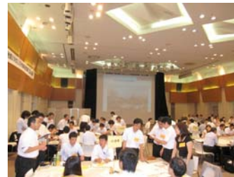
【昨年度の図上訓練の様様】