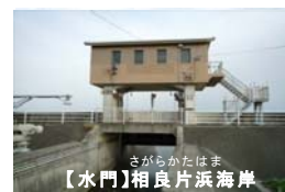
【水門】さがらかたはま 相良片浜海岸

東日本大震災において、水門・陸閘等の現場操作員が多数犠牲となりました。海岸関係省庁（農林水産省及び国土交通省）は、この教訓を踏まえ、 現場操作員の安全の確保を最優先とし、水門・陸閘等の操作を確実に実施できる管理体制の構築に資するため、本年1月より「水門・陸閘等の効果的な管理運用検討委員会」を設置し、検討を行ってまいりました。 （別紙1）