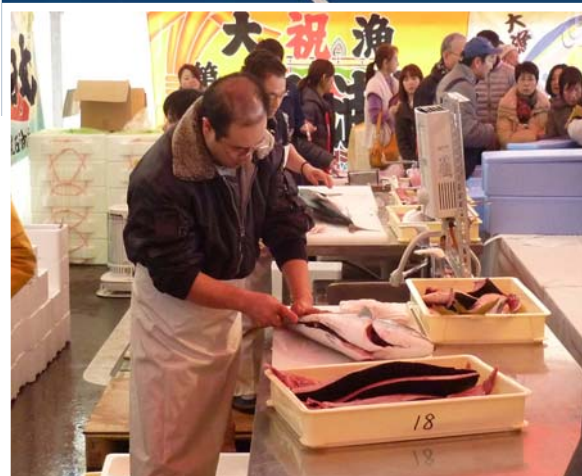
のと寒ぶりまつり