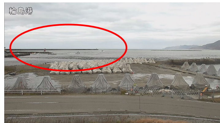
最大震度7の地震から約6分後 漁船が沖合に移動