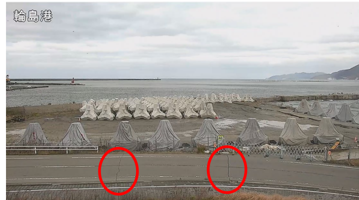
最大震度7の地震(16:10)直後 道路に亀裂が発生