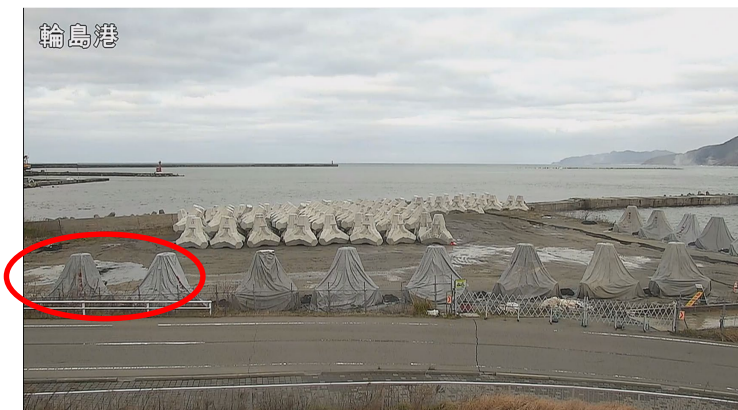
最大震度7の地震から約2分後 地面から湧水