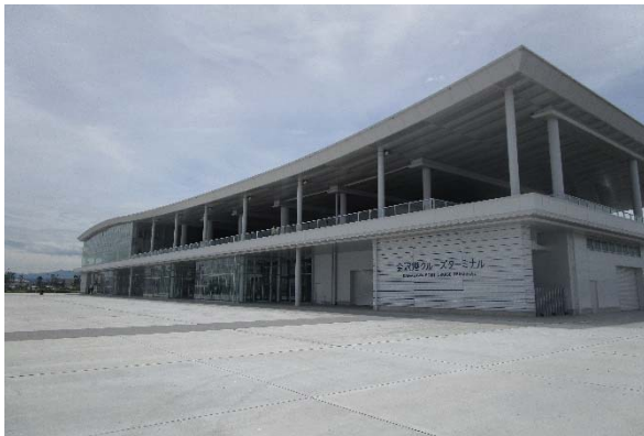
金沢港クルーズターミナルの様子（港側）

6月1日（月）、石川県が金沢市無量寺地内に整備した金沢港クルーズターミナルが開館しました。館内では検温や手指消毒の提供などが行われる中、操船体験などができる「金沢港まなび体験ルーム」やレストラン、展望デッキなど全館利用可能となりました。