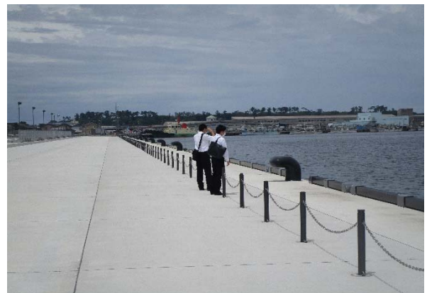
無量寺岸壁の様子 （金沢港湾・空港整備事務所が整備）