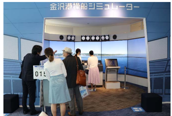
金沢港まなび体験ルーム （金沢港操船シミュレーター）