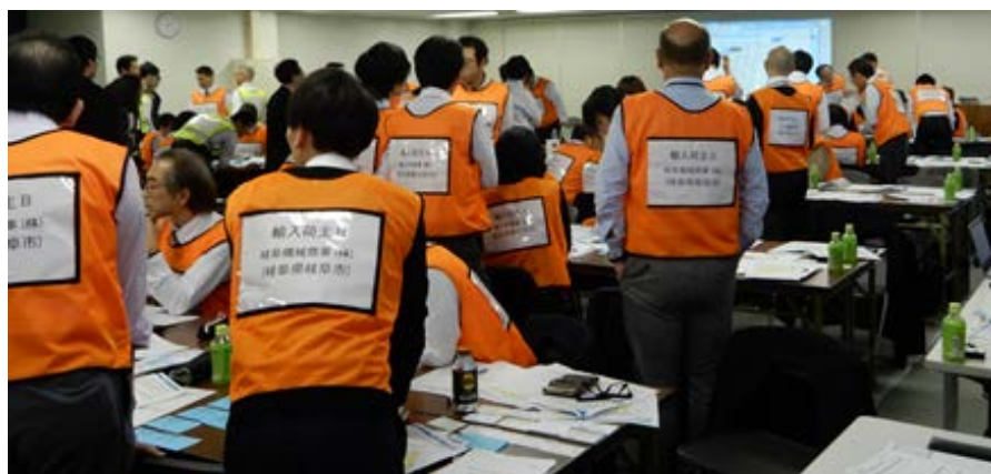
平成30年11月13日 名古屋市内 (参加者数 97名/54団体)