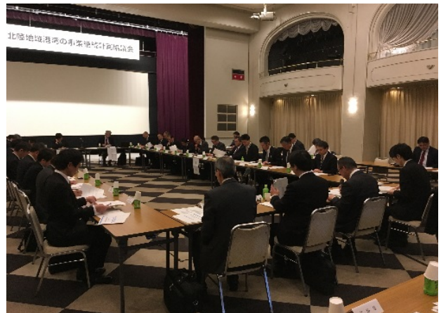
平成 29 年度 北陸地域港湾の事業継続計画検討会の状況