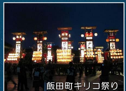
飯田町キリコ祭り